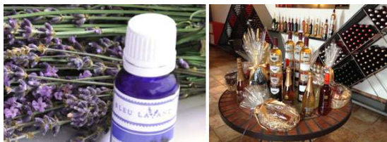
( http://blogue.quebecvacances.com/wp-content/uploads/2015/11 )

Les Marchés de Noël Joliette-Lanaudière ( http://www.quebecvacances.com/marche-de-noel-de-joliette-lanaudiere ) proposent entre autres un village des artisans et des démonstrations de métiers traditionnels. Gâteaux de Noël allemands, pain d'épice, saucisses grillées, marrons chauds et produits du terroir sont au rendez-vous au Marché de Noël allemand ( http://www.quebecvacances.com/marche-de-noel-allemand-quebec ) à Québec. Les marchés de Noël qui se déroulent à Terrebonne ( http://www.quebecvacances.com/marche-de-noel-de-terrebonne ) et à L'Assomption ( http://www.quebecvacances.com/marche-de-noel-de-lassomption ) ne sont pas en reste avec vin chaud traditionnel, spectacles musicaux, ainsi que maisonnettes et lumières de Noël. Pour en savoir plus sur ces événements et les nombreuses activités qui se déroulent cet hiver au Québec, vous pouvez consulter le site www.quebecvacances.com ( http://www.quebecvacances.com ).