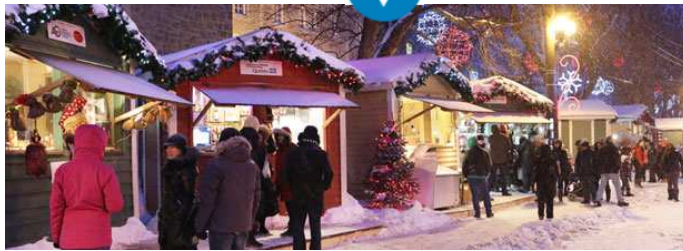
( http://blogue.quebecvacances.com/actualites/inspiration_cadeaux ) Marché de Noël de L'Assomption, crédit photo: Arsenio Coroa