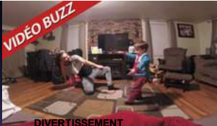
Les joies d'avoir un papa chorégraphe (vidéo) (/divertissement/videos/actualites/modebeaute/magasinage/archives/2015/07/20/150720-3944614548001/)