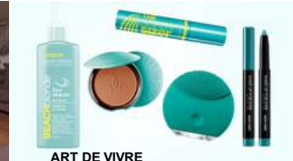
Beauté: On s'inspire de la fraîcheur du turquoise (/divertissement/videos/actualites/modebeaute/magasinage/archives/2015/07/20/150720-135110.html)