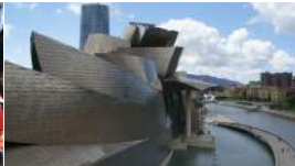
(http://fr.canoe.ca/voyages/galer Ces musées qui sont eux- mêmes des oeuvres d'art (http://fr.canoe.ca/voyages/galer