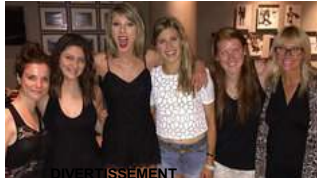
«La plus belle soirée de ma vie» - Eugenie Bouchard (/divertissement/musique/nouvelles/archives/2015/07/20/150720-091259.html)