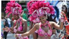
(http://fr.canoe.ca/voyages/destinations/monreal-carifesta/281501001) Montréal vibre au rythme des Caraïbes pour la Carifesta (http://fr.canoe.ca/voyages/desti