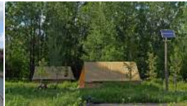
(http://fr.canoe.ca/voyages/desti Camper au parc national des Îles-de-Bourcherville (http://fr.canoe.ca/voyages/desti

Toutes les photos (/voyages/galeries_photos/)