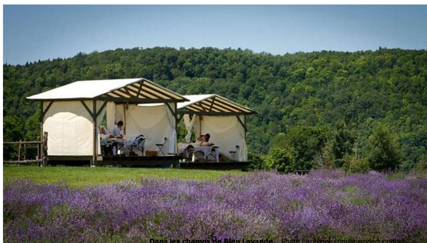
Dans les champs de Bleu Lavande.