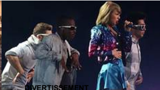
Taylor Swift: un spectacle réglé au quart de tour (/divertissement/musique/nouvelles/archives/2015/07/20/150720-225702.html)